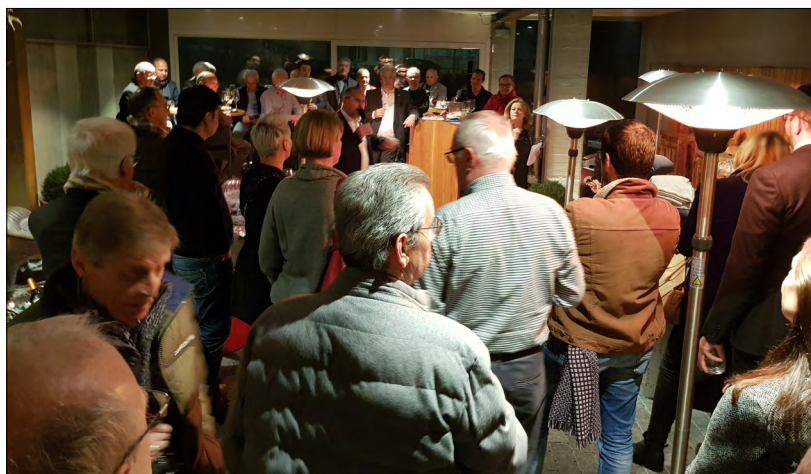
Au Manoir, pendant les discours, on remarque quelques Rotariens d'Aigle

qui est attendu de cette action si bien que nous ne pouvons que recommander d'y participer. Pour cela, réservez le 28 février , préparez 100 Fr. pour le menu et prévoyez d'y ajouter un montant pour les boissons et inscrivez-vous par un texto (SMS) au numéro 079 833 51 42. Vous vous rendrez ensuite à Monthey entre 18h30-19h30, à la salle de la paroisse protestante «en Biolle» (Avenue de l'Europe).