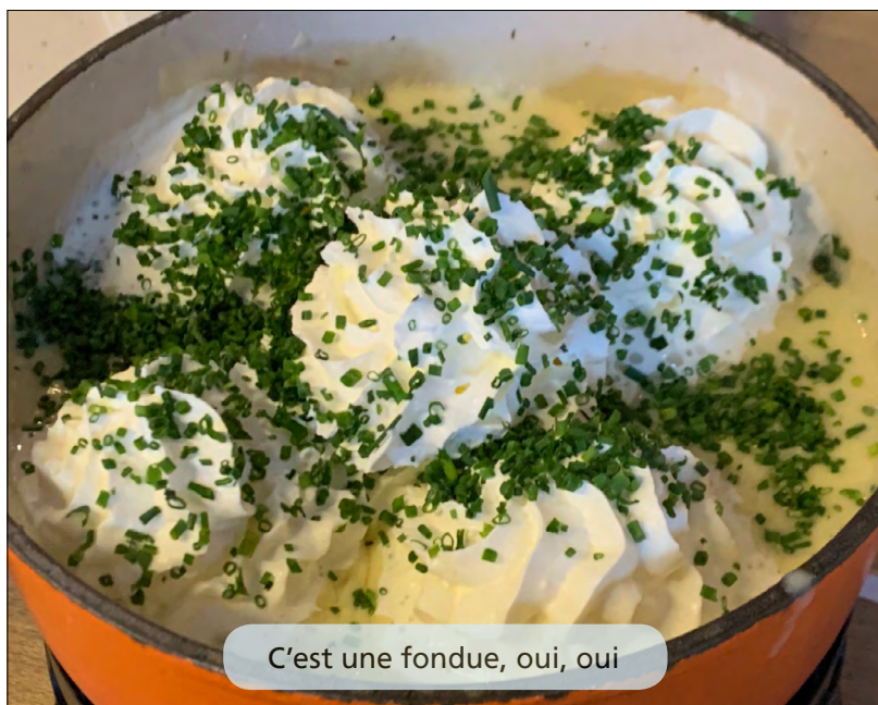
C'est une fondue, oui, oui