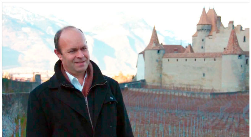
Photo tirée d'un film de promotion PLR