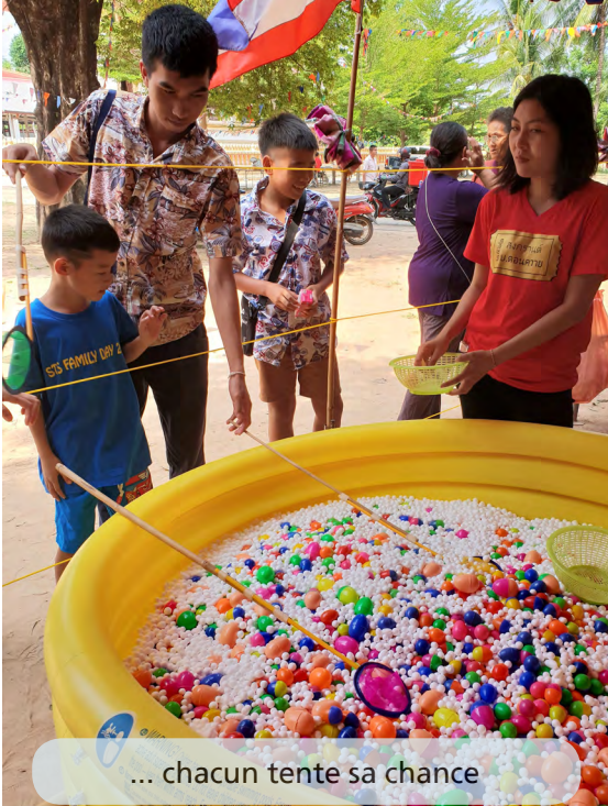
... chacun tente sa chance