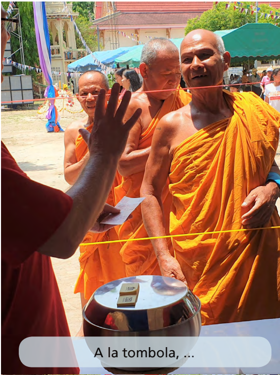
A la tombola, ...