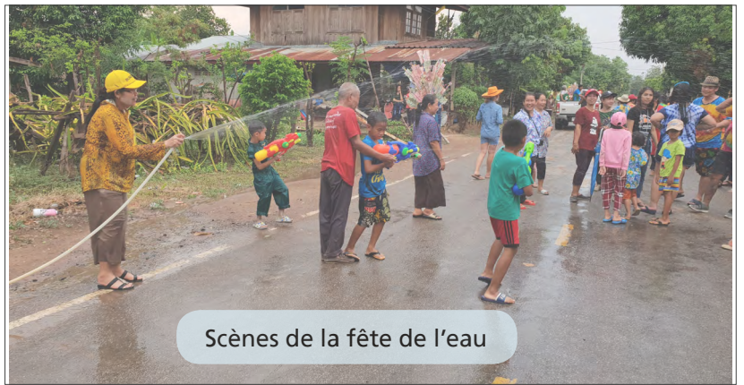
Scènes de la fête de l'eau