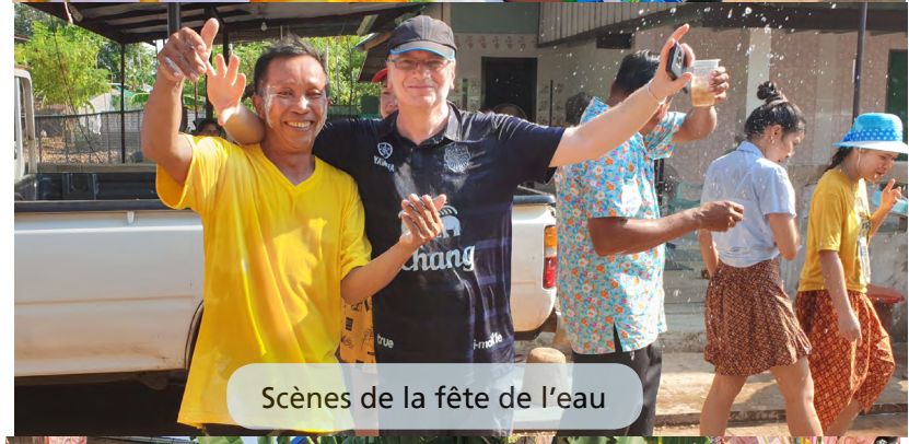
Scènes de la fête de l'eau