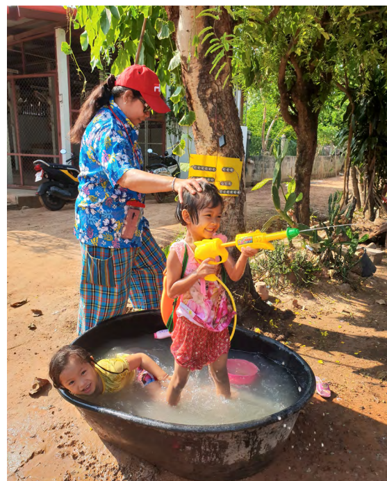
Scènes de la fête de l'eau