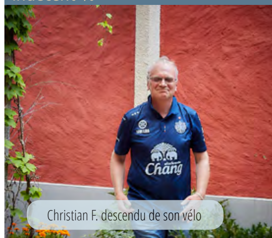
Christian F. descendu de son vélo