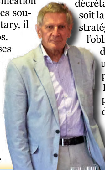
Conférence de reclassification:

lin, le meunier retenait de sa production la quote-part destinée au paysan et livrait cette farine au boulanger qu'il avait