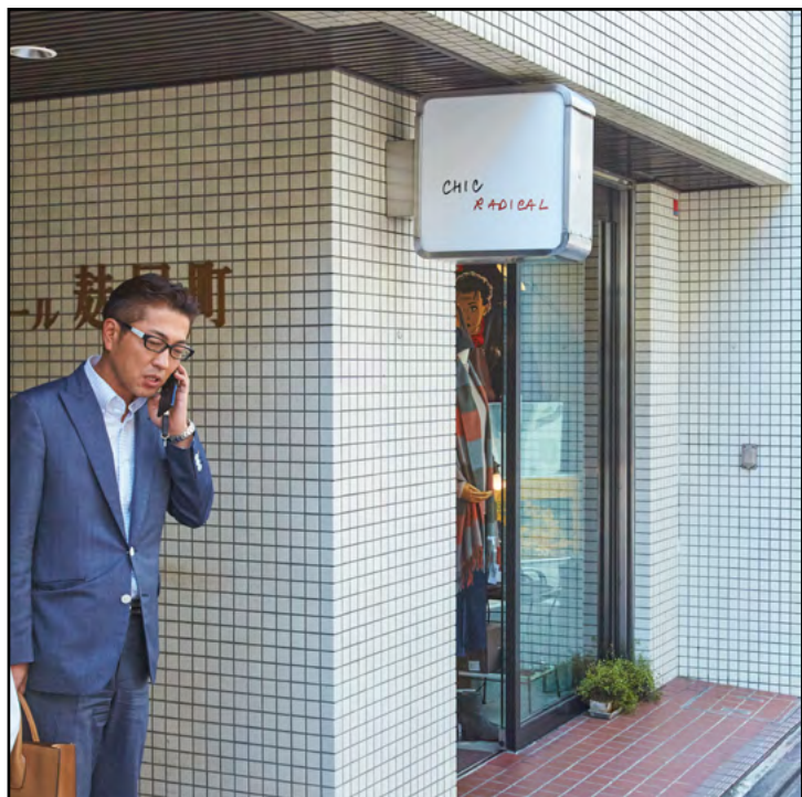
Vu dans les rues de Kyoto, se passe de commentaires, n'est-ce pas ?