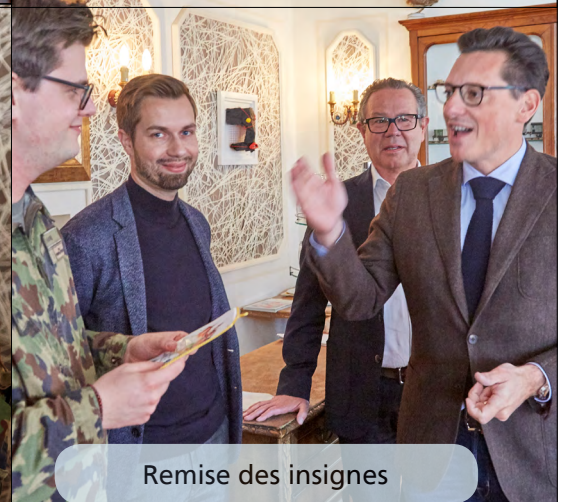
Remise des insignes