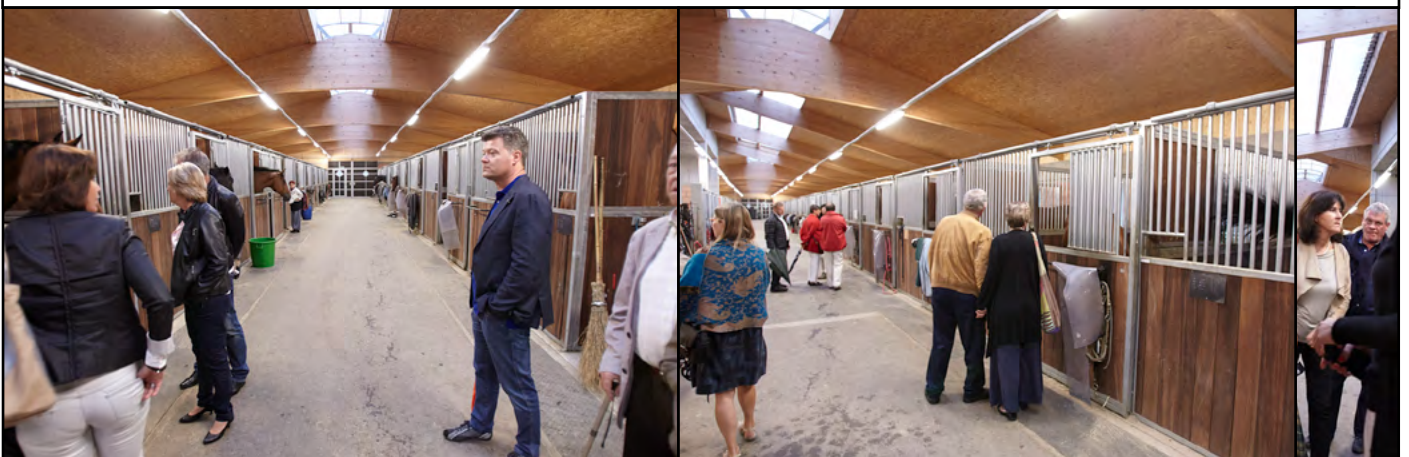
Visite des boxes