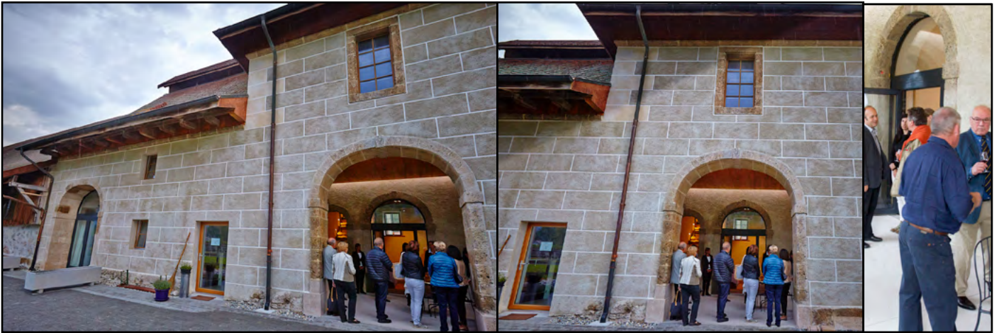
Façade rénovée du Domaine du Rhône à l'heure de l'apéritif! Ci-dessous, la façade austère de cet ancien dépôt de sel bernois