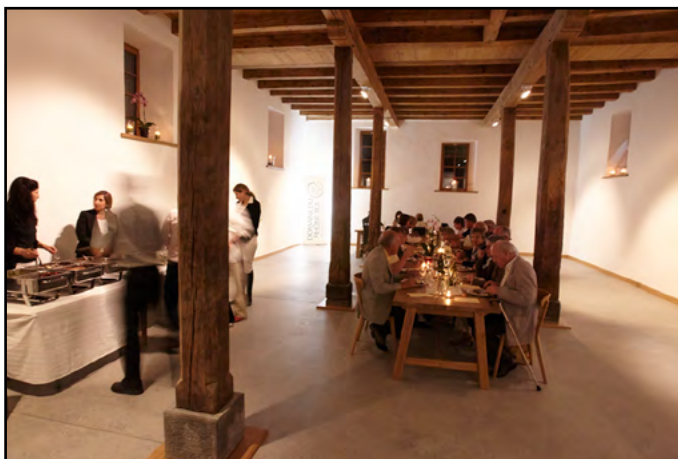
La salle des banquets, notez la présence des directrices au service: remarquable !

Toutes nos félicitations aux heureux parents !