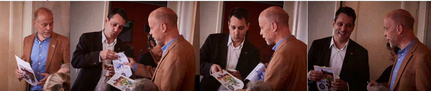
Un homologue Aiglon qu'au lieu de la traditionnelle bouteille de vin, il se voit obligé d'offrir un pot de miel ... avec un fanion

5 à moitié prix. Il va falloir se battre n'est-ce pas. La réponse devrait s'appeler Ariane 6 et apco y participera comme contractant de niveau 1.