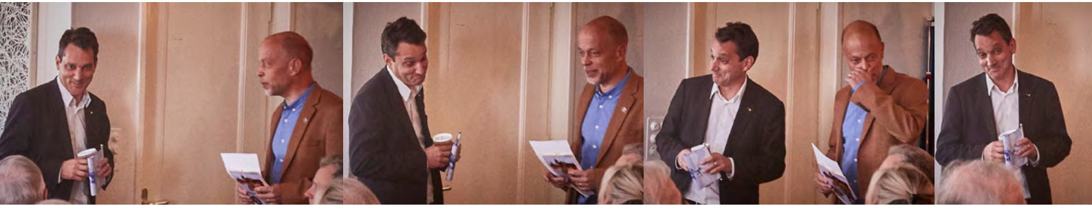
Le Président du club Rotary Morges, cherchant de l'aide à droite et à gauche, se demande comment il va bien pouvoir oser annoncer à son

Ce ne sont pas moins de dix-huit Rotariens Morgiens, accompagnés de trois de leurs épouses qui ont partagé le déjeuner d'amitié du club d'Aigle.