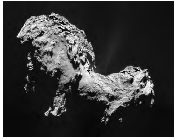
Cherchez attentivement, un produit apco s'y trouve

André Pugin mesure sa chance de pouvoir travailler dans le spatial. Sa société est spécialisée dans les MGSE 1 (Moyens support sol), toute pièce qui doit respecter les extraordinaires contraintes du domaine spatial, en particulier les moyens de transport et de conditionnement. Naturellement les produits APCO, issus de l'environnement économique suisse, doivent contenir beaucoup de valeur ajoutée, par exemple sous forme de recherche et de développement en ingénierie. Le spatial est incroyablement exigeant en termes de conditions de fonctionnement, mais aussi en termes concurrentiels. Le développement acharné est la condition sine qua non de l'existence d'une entreprise active dans ce domaine. Elon Musk met sur le marché un lanceur Falcon équivalent à Ariane