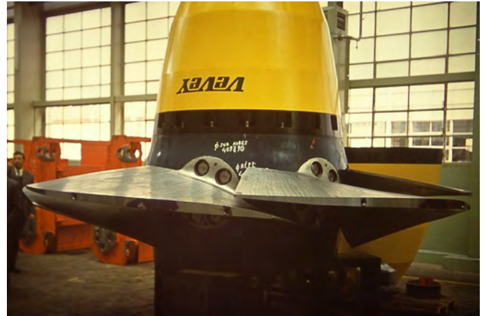
Turbine Kaplan des ACMV

connu un développement constant, passant à 110 personnes en 2010 et 280 aujourd'hui.