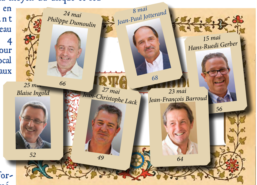
Ces heureux Rotariens ont leur anniversaire ces jours, qu'ils soient félicités !

Finalement, à force d'hésitations, vous craigniez d'avoir manqué l'échéance pour l'inscription au voyage de Fréjus. Rassurez-vous, les inscriptions sont toujours