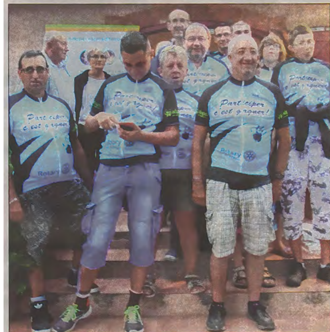
Une partie des cyclistes qui vont s'aligner au Roc d'Azur en compagnie de leurs sponsors et amis, membres du Rotary Club de Fréjus les Bouches de l'Argens.