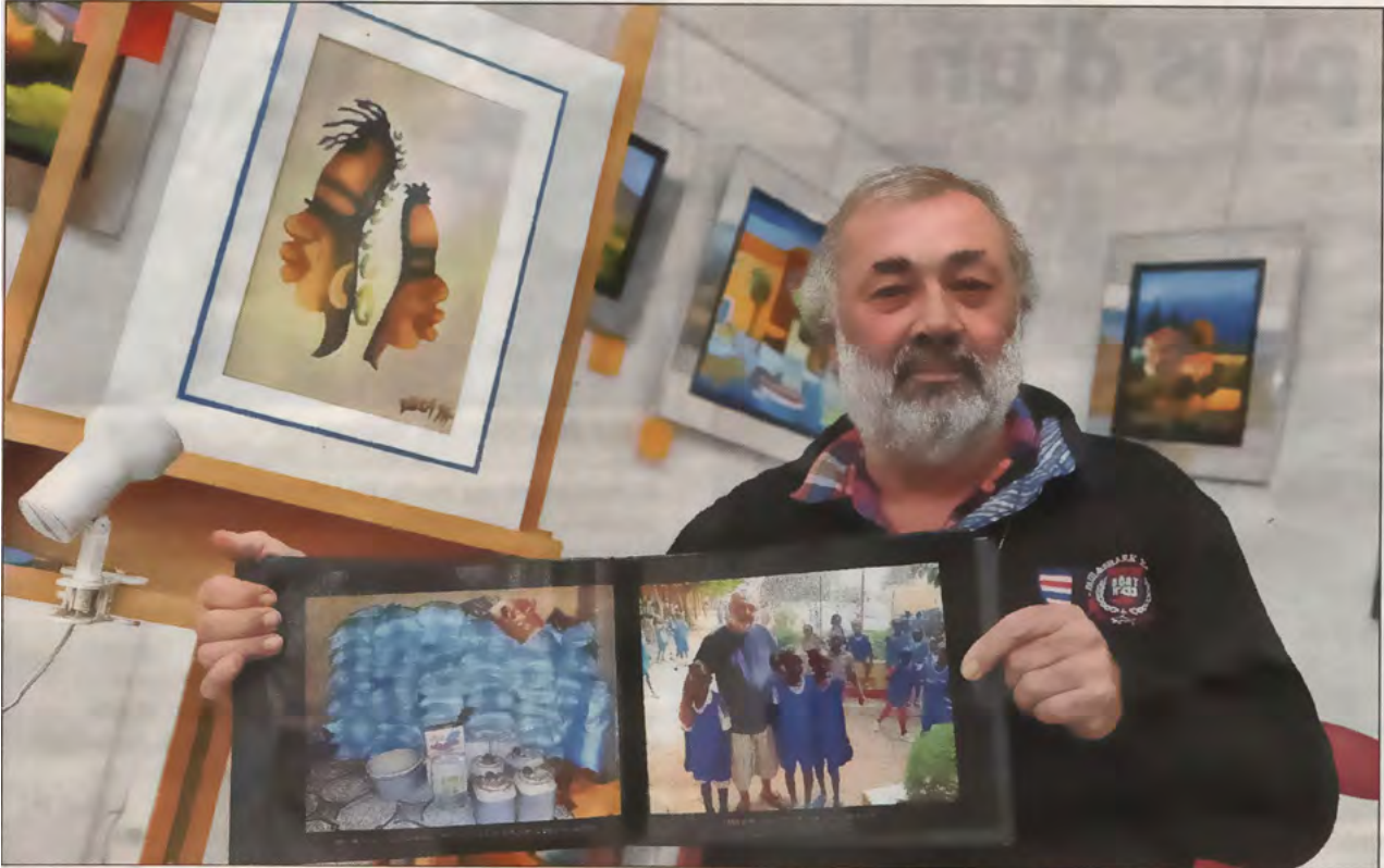
L'artiste-peintre fréjusien va, une nouvelle fois, partir aider des jeunes au Sénégal.