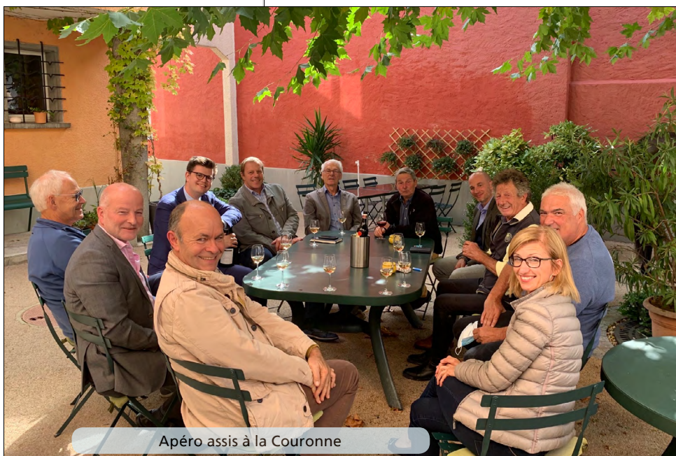
Apéro assis à la Couronne