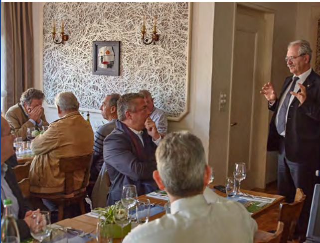
L'ancien gouverneur fait preuve de modestie alors que le présent gouverneur lui rend hommage

Telle est l'appréciation du gouverneur qui se réjouit de l'extraordinaire richesse du Rotary.