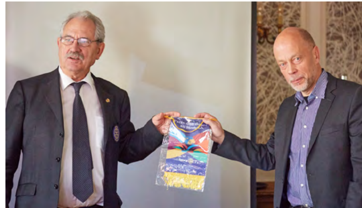
Remise du fanion

Le comité d'organisation de la LAN PARTY (COLP) travaille d'arrache-pied. Pour que tout ce labeur ne reste pas dans l'ombre des milieux Rotariens, le TRAIT D'UNION est heureux de vous en répéter les traits sail-