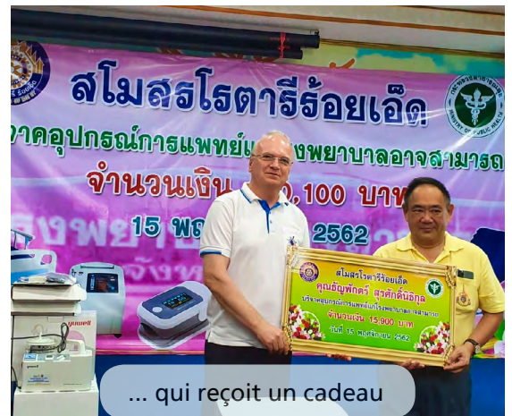
... qui reçoit un cadeau