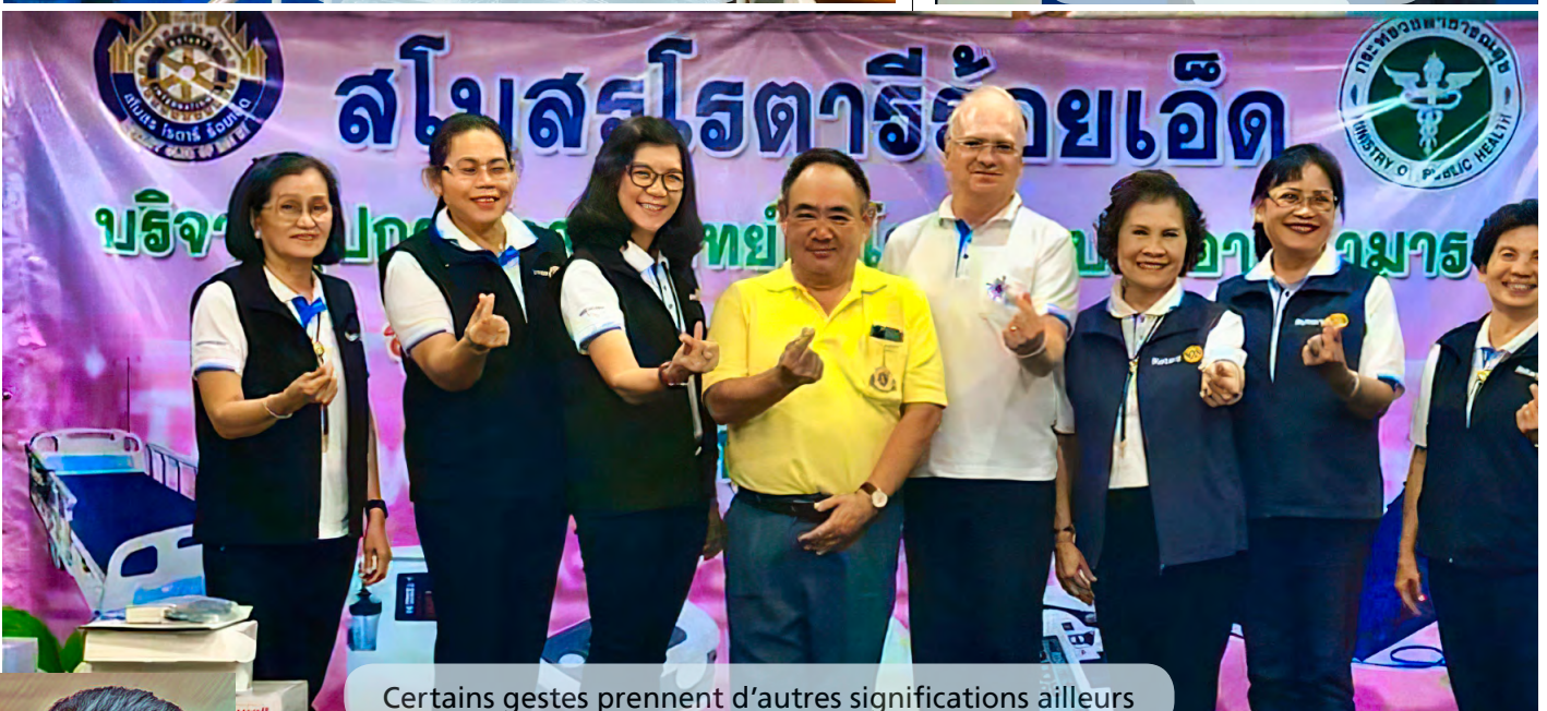
Certains gestes prennent d'autres significations ailleurs