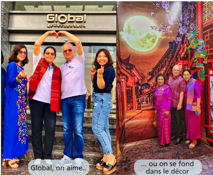
Global, on aime..