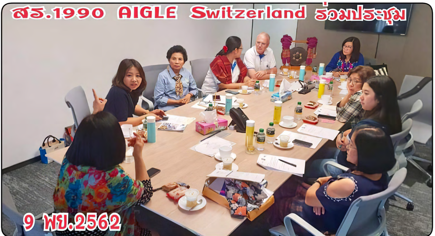
สว. 1990 AIGLE Switzerland ร่วมประชุม