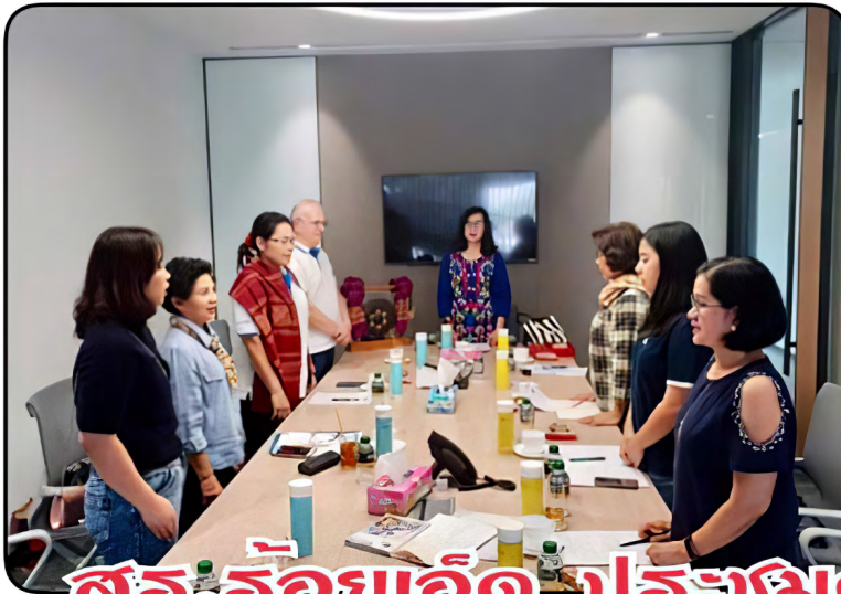
สว. รอยเอ็ด ประชุมครั้งที่ 8/2562