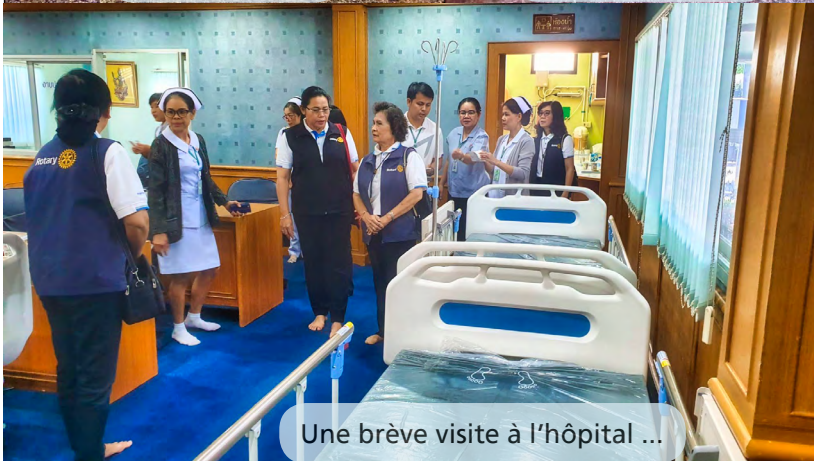
Une brève visite à l'hôpital ...