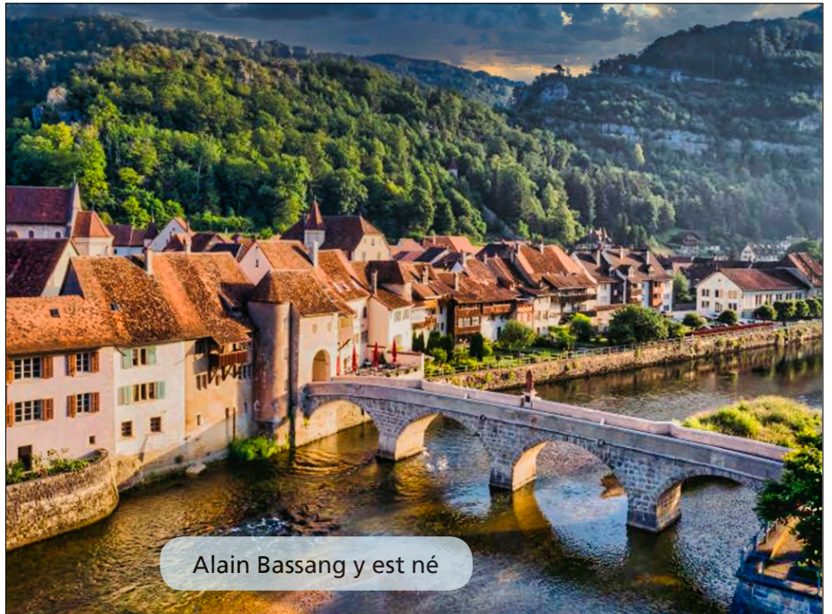
Alain Bassang y est né

L'imprimerie a connu des temps difficiles, Corbaz vendue, IRL, puis Swissprinters, puis IRL+, qui avait été rachetée par ses directeurs,