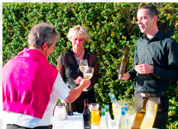
image valant mille mots comme l'aurait dit un empereur célèbre, nous nous sentons excusés.