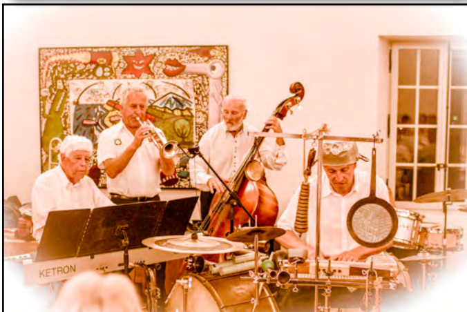
Les Jazzmen tellement bon qu'on regrette d'avoir oublié leur nom, dans un prochain bulletin peut-être ?