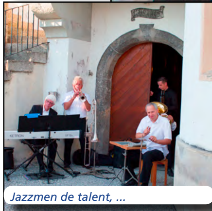
Jazzmen de talent, ...