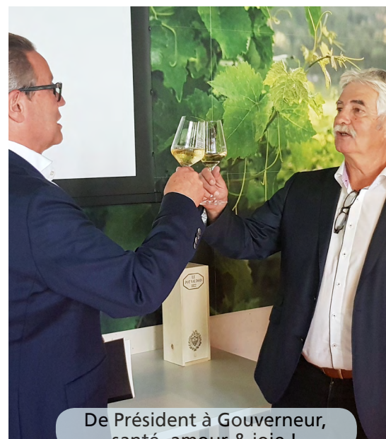
De Président à Gouverneur, santé, amour & joie !

Cette semaine encore les Rotariens ont été désaltérés par les deniers du trésor. Peut-être pourront-ils compter sur ceux