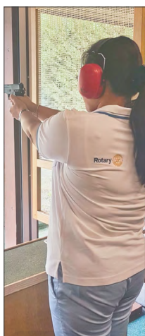
Silence, on tire

Il y a foule au tableau d'honneur des Rotariens d'octobre ! Joyeux anniversaire à chacun